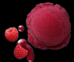
MÖVENPICK Crème Vanilla Art.-Nr. 24734