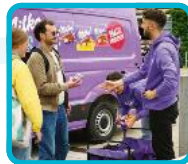
INFLUENCER & EVENTS